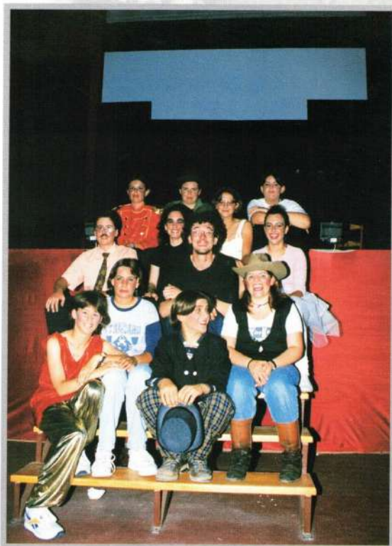
TEATRO COLEGIO ANTONIO GALA

Como ves ya estamos preparando las actividades para lo que queda del 97 y