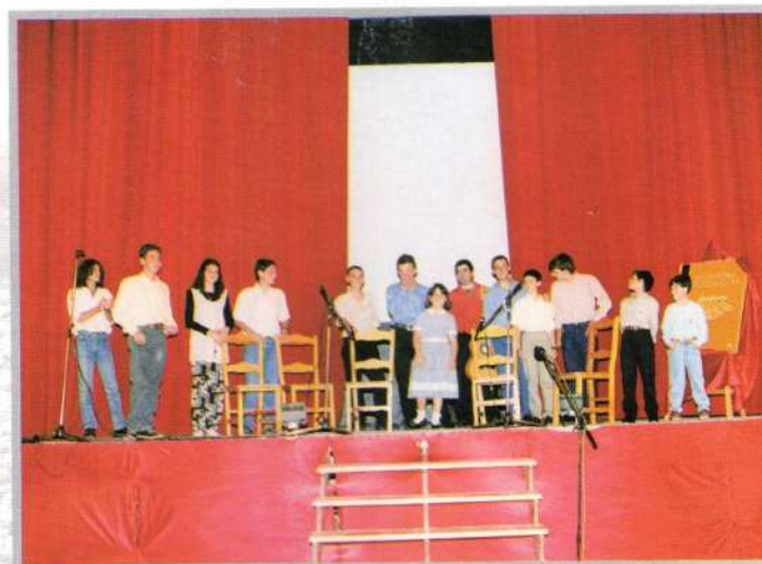
AULA DE GUITARRA

Este año desde el 19 de mayo hasta el 20 de junio transcurrieron las ya tradicionales actividades culturales de la primavera. Este año hemos contado con importantes novedades, además