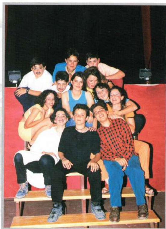
TEATRO EL PINAR

Después de la Feria, tendremos varias Jornadas sobre Educación Sanitaria y en