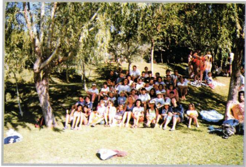
COLONIAS DE VERANO

Con los niños estuvimos en Las Colonias de Verano con un