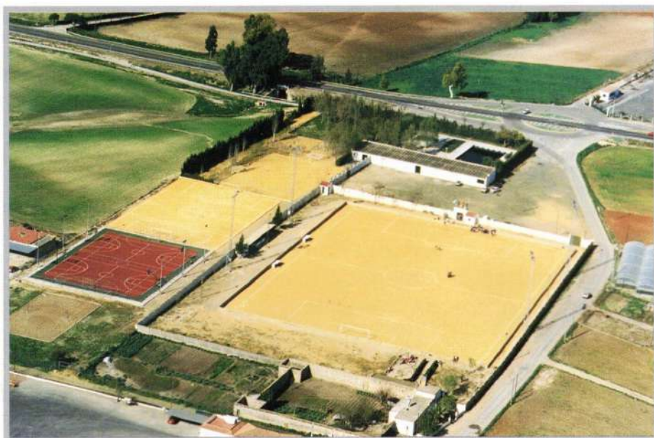
Vista aérea Complejo Polideportivo Andrés Villacieros.