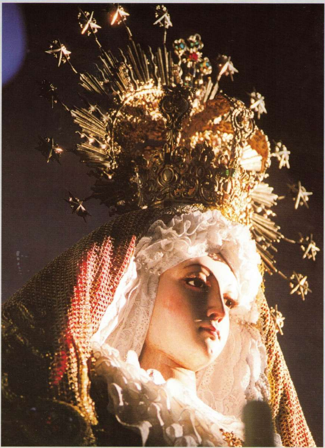
Nuestra Señora del Rosario