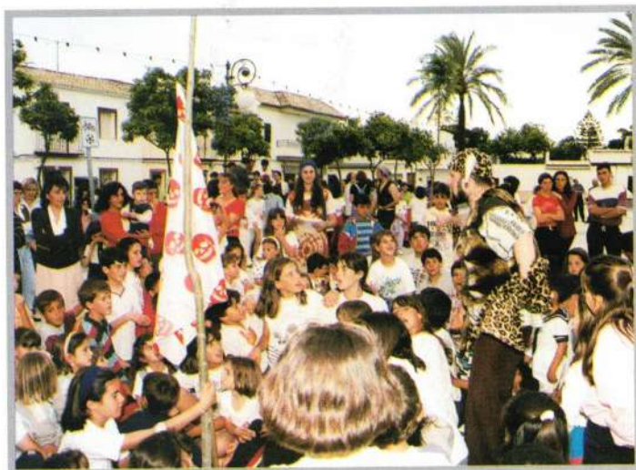
PASACALLES "LOS PIRATAS DE ALEJANDRIA"

de seguir con otras actividades ya habituales.