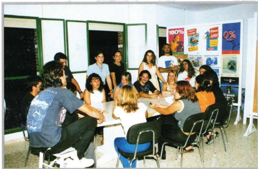
COLABORADORES DEL C.I.J.

Además de esta Actividad hemos recogido las ideas de muchos de los jóvenes de El Cuervo, así hemos organizado actividades dirigidas a diferentes colectivos.