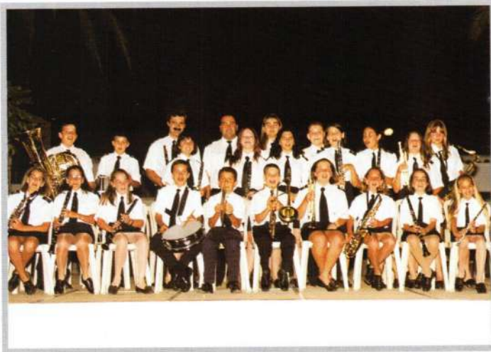
BANDA MUNICIPAL DE MUSICA

El día 19 de junio los alumnos del aula de Música, futura Banda Municipal actuaron de nuevo. Gracias al Grupo de Teatro "El Molino" se puso el broche a todos