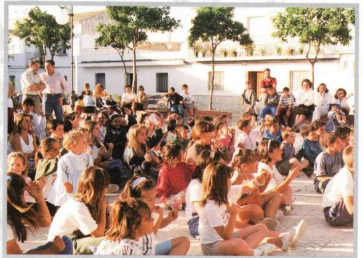
AVTIVIDAD DE ANIMACION A LA LECTURA

No podemos olvidarnos de los alumnos del aula de Guitarra, los alumnos del aula de Música, los del aula de Pintura (promotores y organizadores de la exposición que cada año se monta).