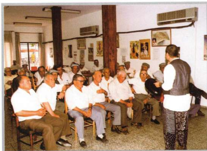
AVTIVIDAD: RELATOS PARA ADULTOS

El mes de agosto se completa con actividades desde la Delegación de Juventud y la de Cultura. Cada viernes y sábado la Plaza de la Constitución fue protagonista de muchos y variados eventos musicales.