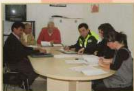
Comisión de Comercio Ambulante