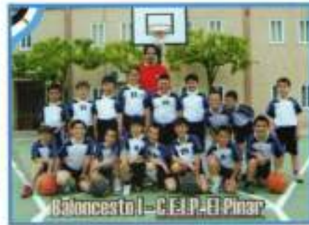
Baloncesto I - C.E.I.P. El Pinar