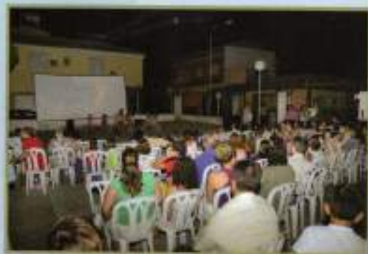
Jornada Cine de Verano, julio 2010