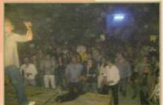
Primera Fiesta de la Primavera