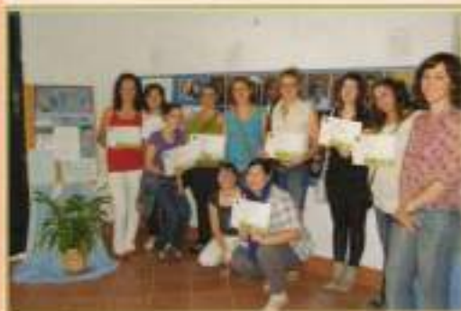
Curso Experiencias Creativas 2010

La Juventud: la semilla para el futuro y el desarrollo de El Cuervo