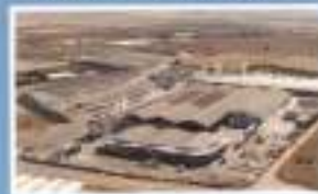
Planta de Prefabricados