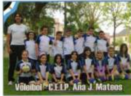
Voleibol - C.E.I.P. Ana J. Mateos