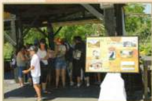
El Cuervo en Isla Mágica 2010