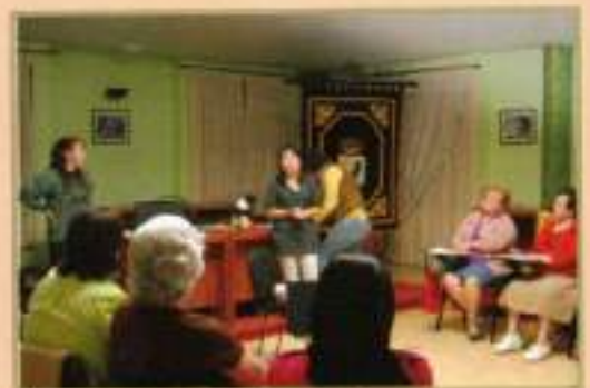
Curso Gestión Asoc. Locales