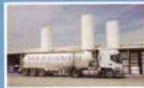
Transporte de escayola en polvo