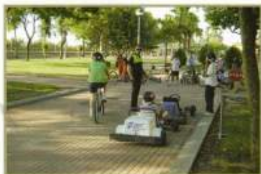
Otro momento de las clases a los alumnos de Educación Vial.