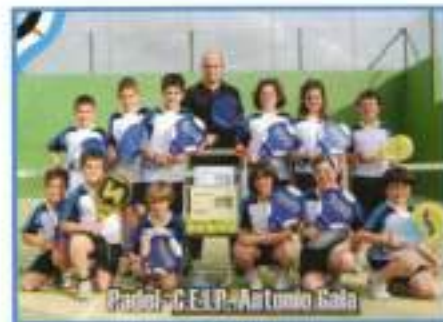
Pádel - C.E.I.P. Antonio Gala