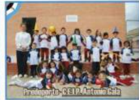
Predeporte - C.E.I.P. Antonio Gala