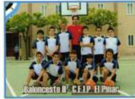
Baloncesto II - C.E.I.P. El Pinar