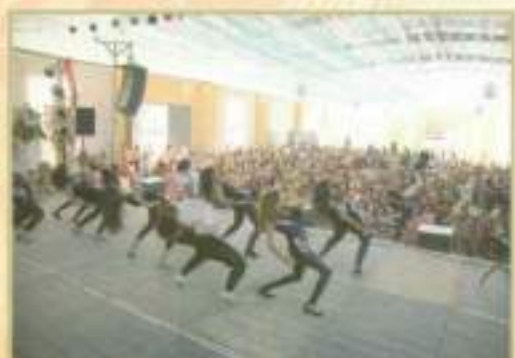
Actuación durante la merienda dedicada a la mujer cuerveña