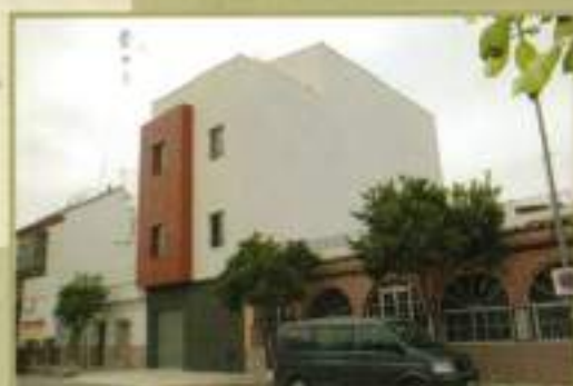
Nuevo Centro de la Mujer