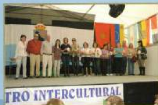
Clausura Día Pan: Asoc. AMTA