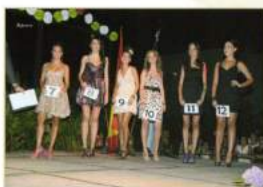
Candidatas a Reina y Damas Mayores 2010