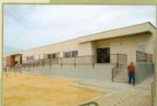
Obras Colegio El Pinar