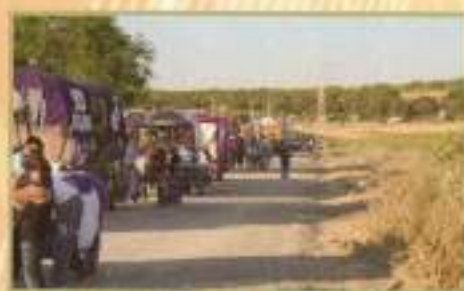
Todas las carrozas lucieron en su decorado con motivo de la Romería

Todos los actos organizados por la Hermandad del Stmo. Cristo del Amor y del Amparo y La Stma. Virgen del Rosario tuvieron un gran éxito