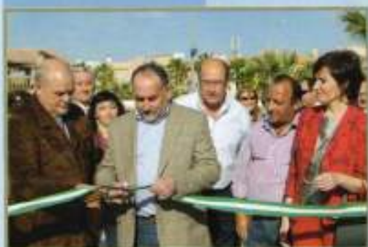
Inauguración XIII Día del Pan