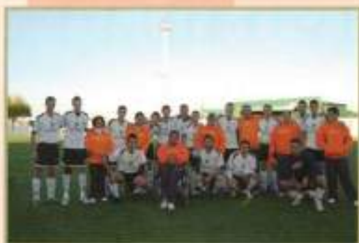
Alumnos CFO con la UD Cuervo