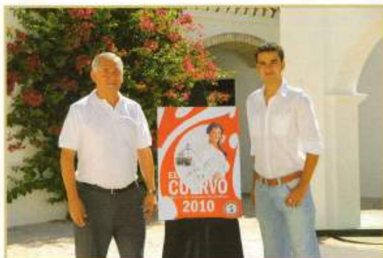
El Concejal de Fiestas y el autor del cartel posan en el patio del Centro Cultural Casa de Postas