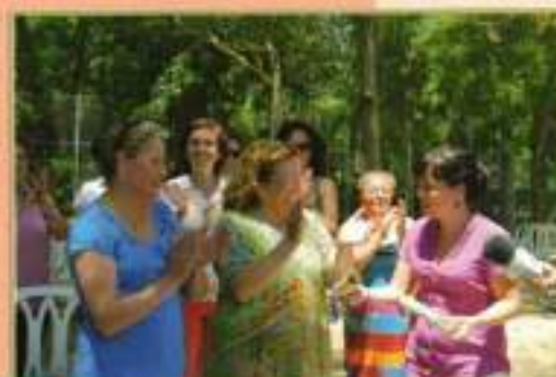
I Encuentro Mujeres Agrícolas AMTA El Cuervo-El Coronil