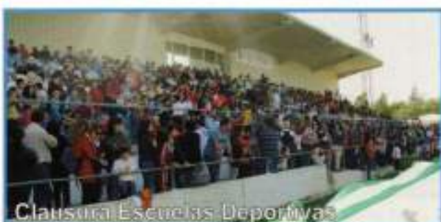
Clausura Escuelas Deportivas