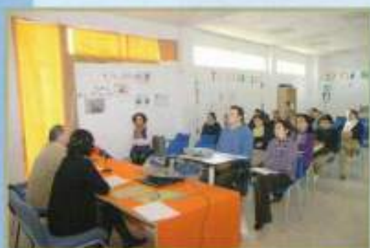
Jornadas en el Centro de Formación