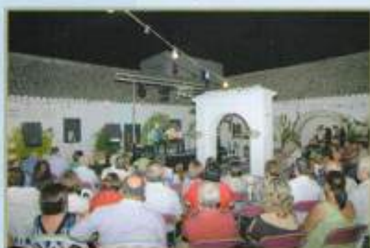
I Noche Flamenca, agosto 2010