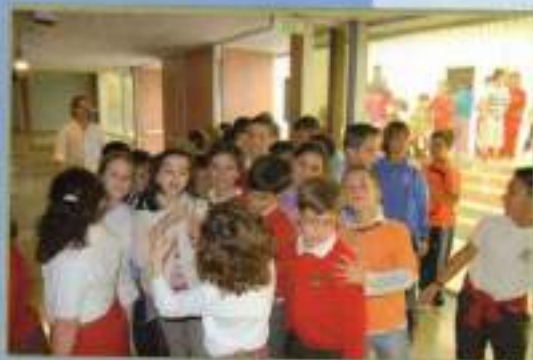
Actividades alumnos Teatro 'El Molino'