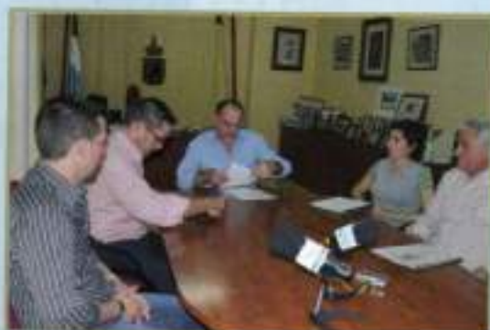
Firma convenio Hermandad 50ª Aniversario