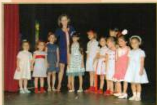
Desfile Taller Corte y Confección