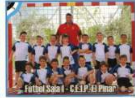
Fútbol Sala I - C.E.I.P. El Pinar