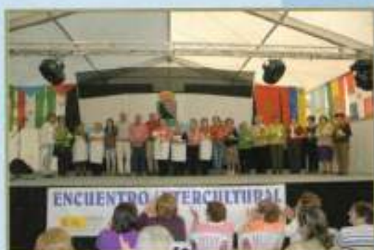
Clausura Día Pan: Asoc. Viudas