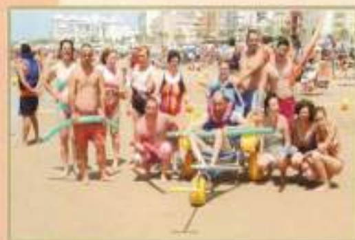
Viaje Personas con Discapacidad de EL Cuervo a Rota 2010