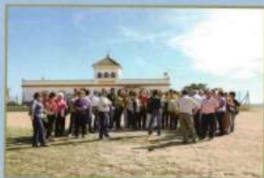
Viaje a la Puebla del Río