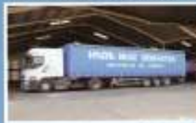
Transporte de envasados y prefabricados