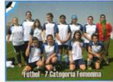
Fútbol - 7 Categoría Femenina