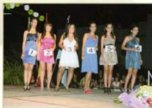
Candidatas a Reina y Damas Mayores 2010