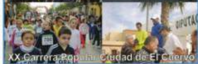
XX Carrera Popular Ciudad de El Cuervo