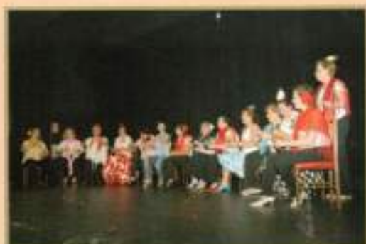
Muestra Taller de Castañuelas