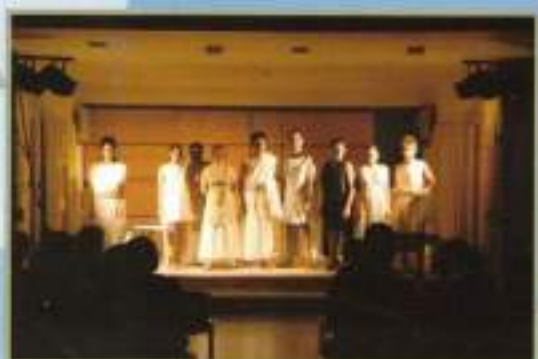
Representación teatral 'Cuatro gatos'