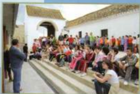
Visita Teatro alumnos Día del Libro