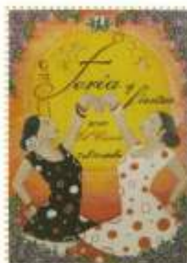
ESCEBAN ZAPATA DELGADO