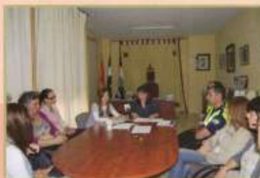
Convenio Asoc. Amigo Fiel y entrega microchip