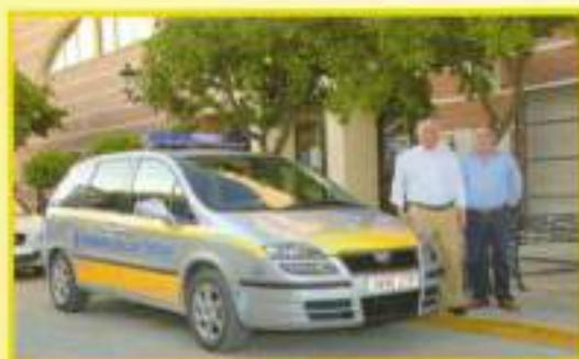
Adquisición de nuevo vehículo para controles de alcoholemia.