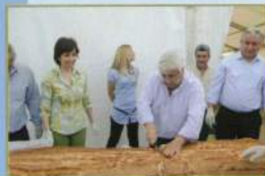
Degustación bocadillo gigante