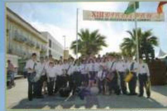
Banda en el XIII Día del Pan 2010