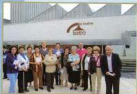
Lectura Día del Libro Centro de Adultos