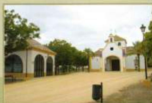
Casa Hermandad en la Ermita