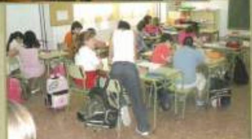
Jornadas Medio Ambiente en colegios