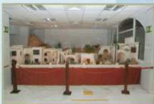
Inauguración Belén Municipal 2010