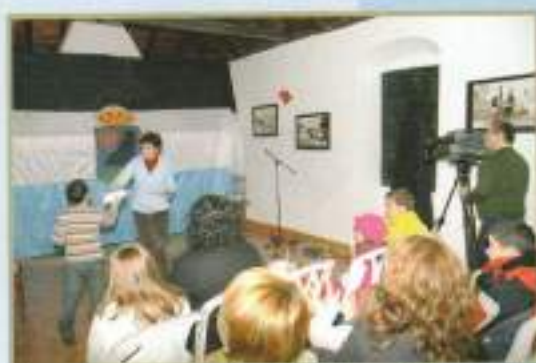
Entrega de premios Concurso Christmas