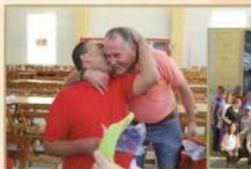
Alumnos CFO Feria 2009