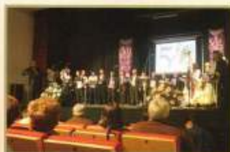
Presentación del Cd conmemorativo del 50º aniversario de la Romería