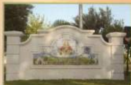
Monolito colocado en la glorieta de la Barriada Andalucía