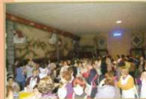
Concurso Gastronómico 2010