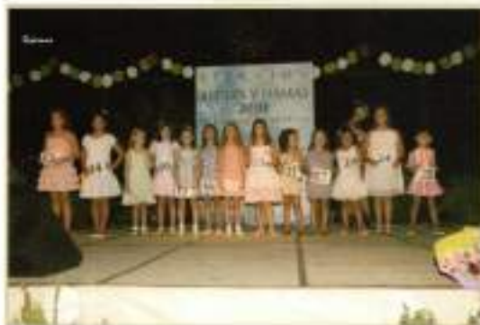
Candidatas a Reina y Damas Infantil 2010