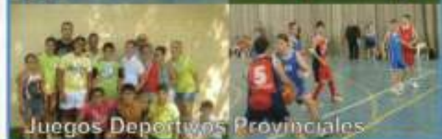
Juegos Deportivos Provinciales