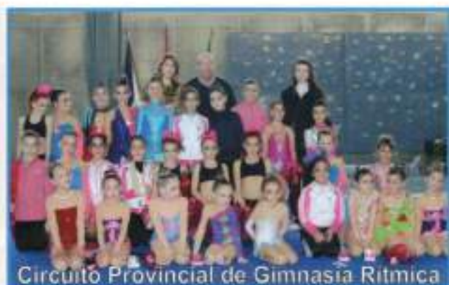
Circuito Provincial de Gimnasia Rítmica