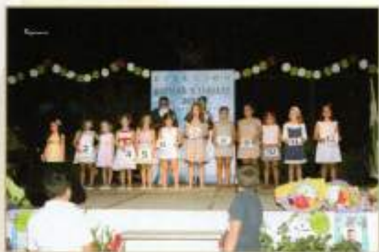
Candidatas a Reina y Damas Infantil 2010