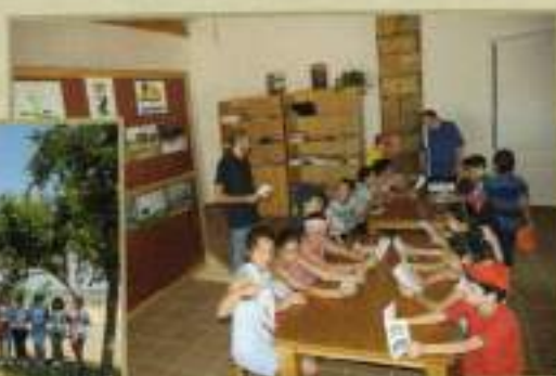
Charla sobre la Laguna