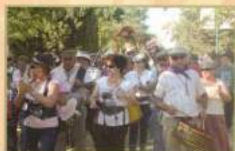
Peregrinos y peregrinas en el camino de regreso de la Ermita