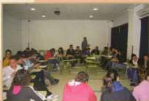
Charla Sexualidad IES Laguna Tollón