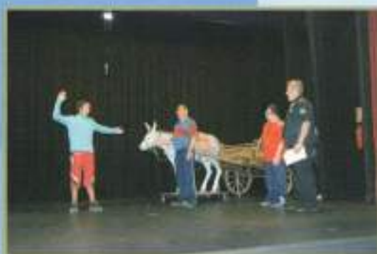
Ensayo obra 'Una señal inocente' Educación Vial