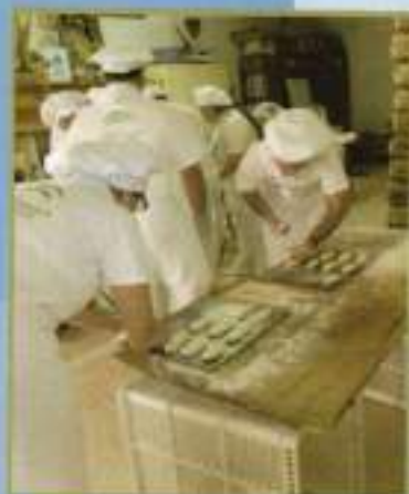
Taller de Empleo: Panadería