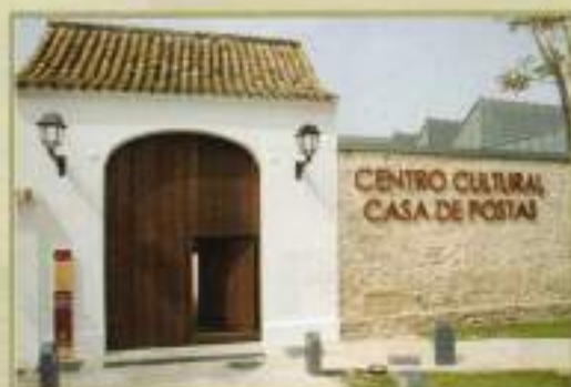
Fachada Centro Cultural Casa Postas