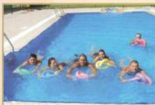
Curso natación personas con discapacidad