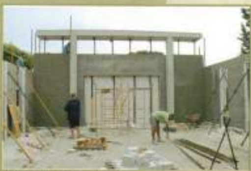
Obras Sala de Duelo