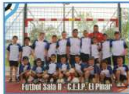
Fútbol Sala II - C.E.I.P. El Pinar