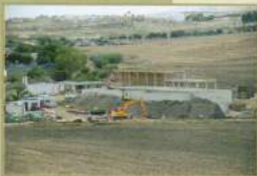
Obras de la Depuradora