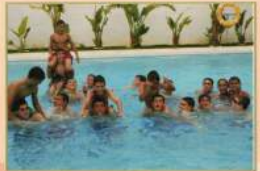
Viaje Colonias 2010

La Juventud: la semilla para el futuro y el desarrollo de El Cuervo