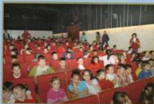
Visita Teatro alumnos Día del Libro