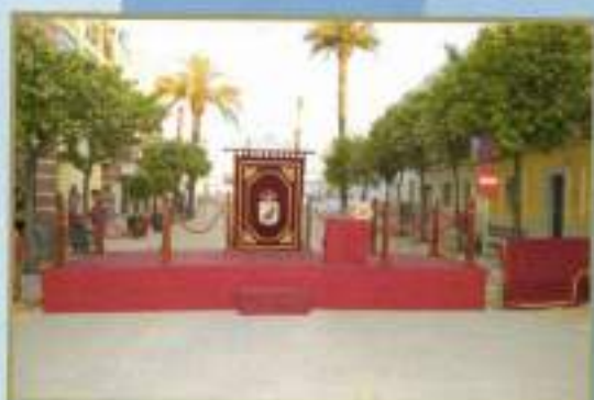
Palco Institucional Semana Santa 2010