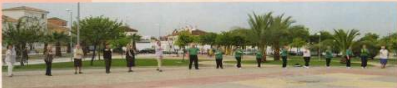
Gimnasia terapéutica en La Ladrillera- Semana de la Salud