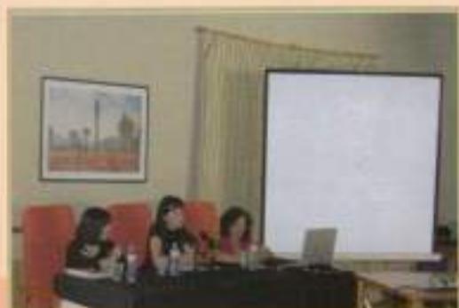
Charla-Coloquio sobre corazón