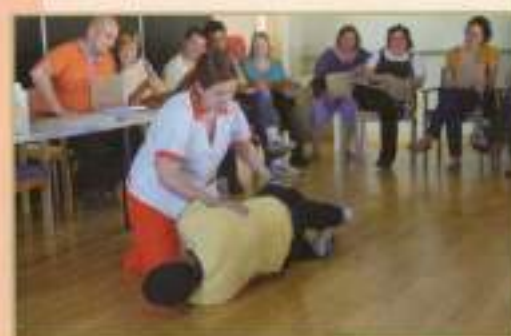
Curso reanimación cardio-respiratoria