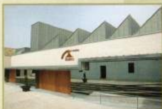
Fachada Teatro 'El Molino'