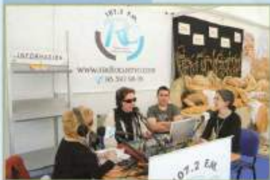
Emisión en directo Radio Cuervo