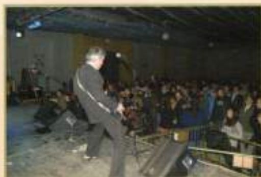
VII Independencia Rock