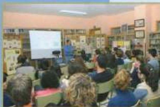
Conferencia sobre arqueología IES