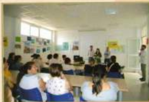
Curso Agricultura Ecológica