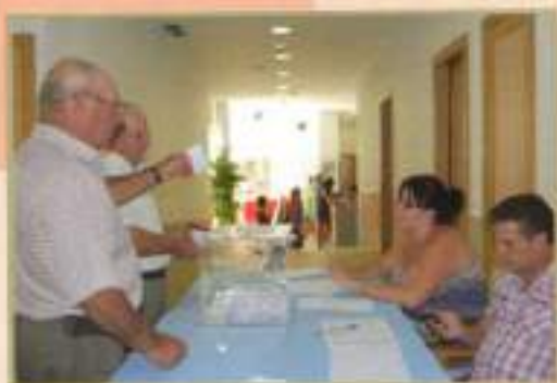
I Elecciones Junta Directiva Centro de Día