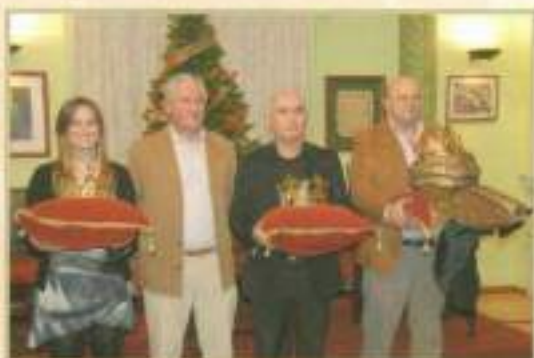
Presentación de los Reyes Magos 2010