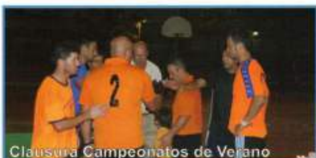
Clausura Campeonatos de Verano