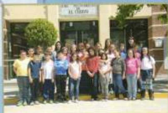
Jornadas de Puertas Abiertas