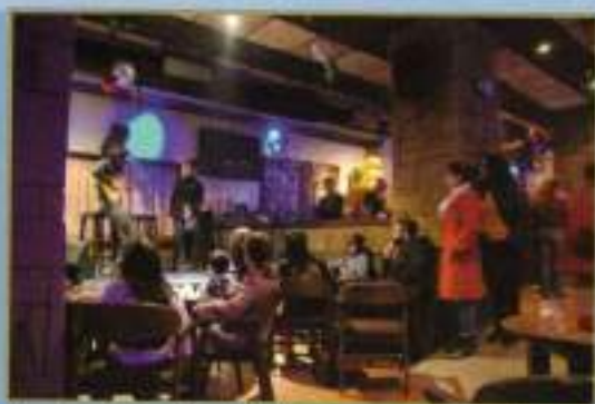
Actuación Cielo 'Artistas de paso'