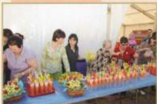
Cóctel sin alcohol-Campaña Hábitos saludables Asoc. Gibalbín