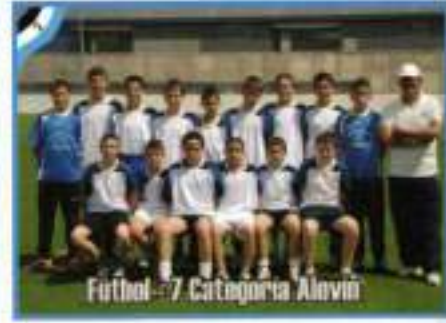
Fútbol - 7 Categoría Alevín