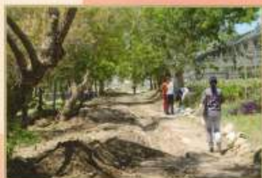
Mejoras y adecentamiento CFO