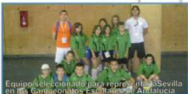
Equipo seleccionado para representar a Sevilla en los Campeonatos Escolares de Andalucía