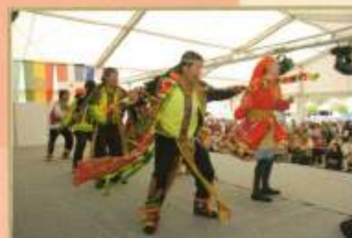
V Festival Intercultural 2010