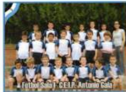
Fútbol Sala I - C.E.I.P. Antonio Gala