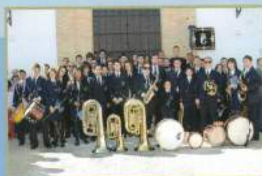
Banda Municipal Ntra. Sra. del Rosario