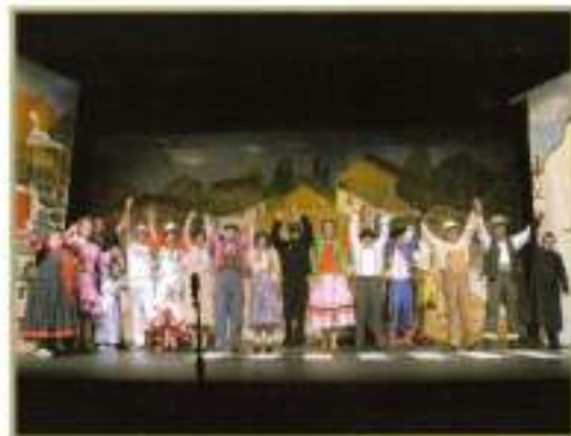
Saludando al público después de la representación