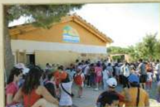
Alumnos CEIP en el Aula Naturaleza