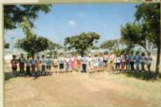
Jornadas Día del Medio Ambiente