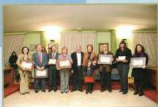
Pleno Institucional 19 de Diciembre