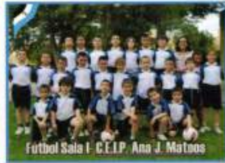
Fútbol Sala I - C.E.I.P. Ana J. Mateos