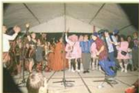
Entrega de premios Carnaval 2010