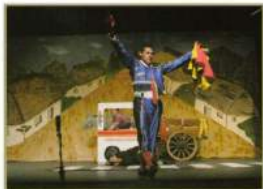
La obra "Una señal inocente" durante una de sus escenas.