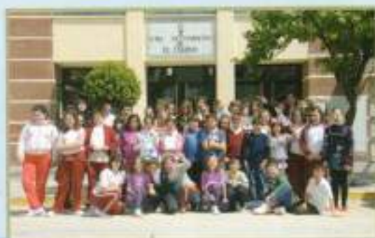
Jornadas de Puertas Abiertas