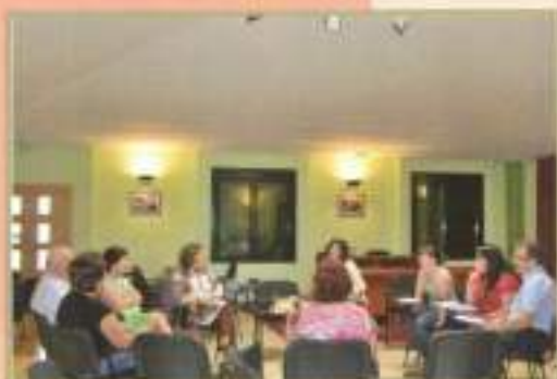
Impulso Asoc. Familiares enfermos Alzheimer