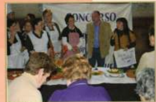
Premios Concurso Gastronómico