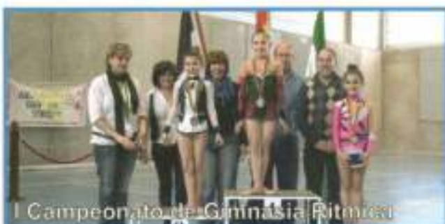
I Campeonato de Gimnasia Rítmica