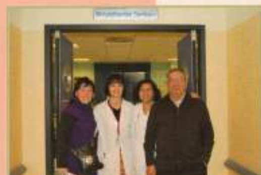
Convenio H.Valme 'Por un millón de pasos'