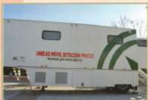
Campaña Prevención Cáncer de Mama