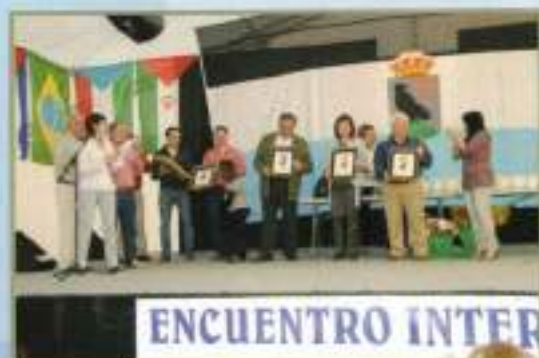
Clausura Día Pan: Gremio Panaderos