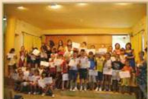
Escuelas de Verano 2010