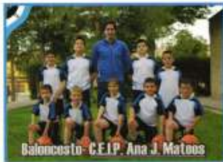
Baloncesto - C.E.I.P. Ana J. Mateos