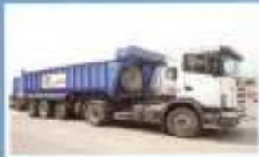
Transporte de piedras