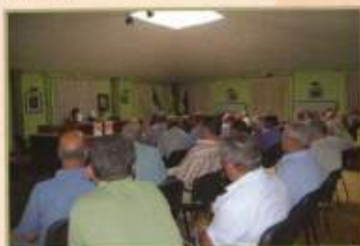
Comisión de Huerteros 2010