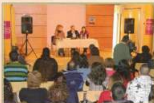
Charla creación Delegación Cruz Roja en El Cuervo