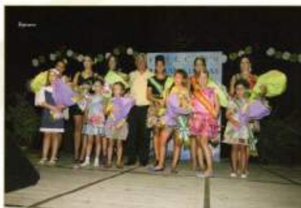
Reina y Damas 2010 acompañadas por el Delegado de Fiestas