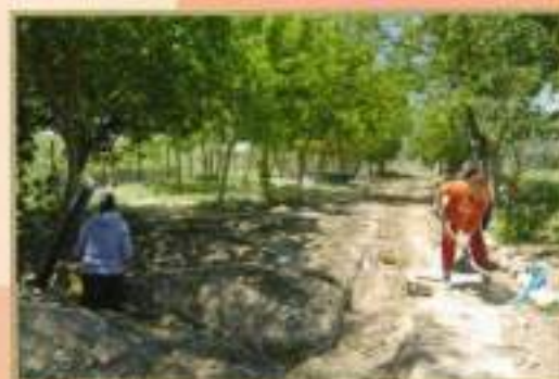
Inserción 50% Mujeres PER Estable