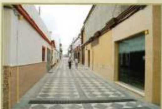
Peatonalización Calle Bornos