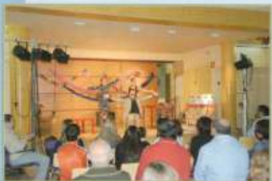
Representación teatral 'El rastro'