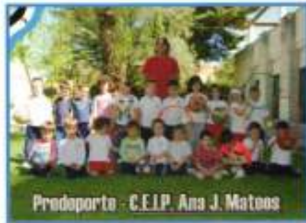
Predeporte - C.E.I.P. Ana J. Mateos