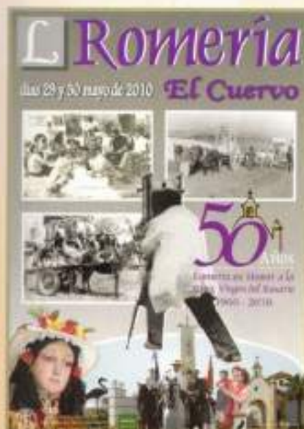
Cartel ganador del concurso con motivo del 50º Aniversario

Los cuerveños y cuerveñas no quisieron que pasaran desapercibidos los 50 años de Historia de nuestra Romería. Se volcaron desde la salida de Nuestra Patrona la Stma. Virgen del Rosario de la Parroquia de San José, el sábado 29 de mayo a las 10 de la mañana hasta su llegada el domingo 30 sobre las 24 horas. Todo un fin de semana lleno de armonía, convivencias y recuerdos.