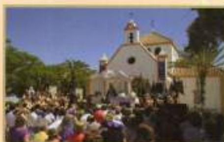
Presentación de Asociaciones y Hermandades