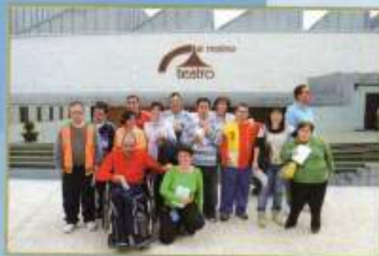
Lectura Día del Libro alumnos CFO