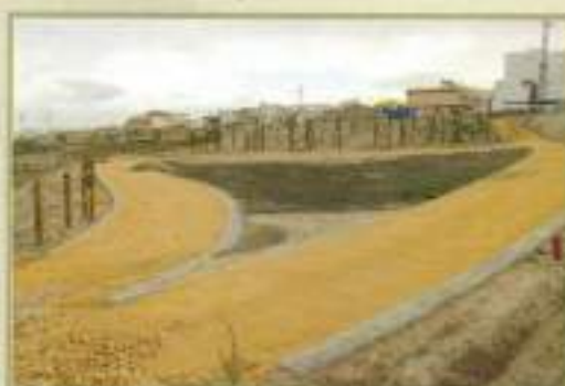
Parque Periurbano La Ladrillera