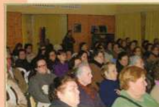
Charla sobre Fibromialgia 8 marzo