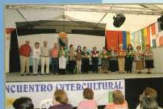
Clausura Día Pan: Asoc. Progresistas