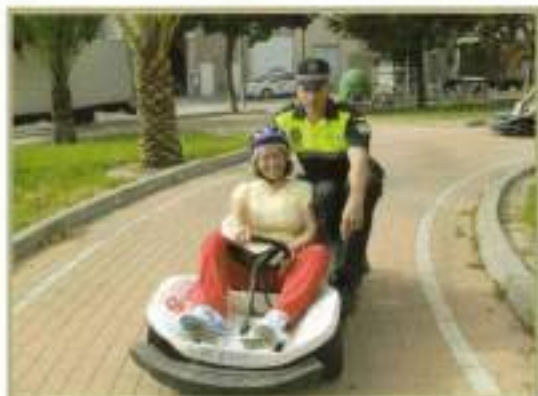
Monitor de Educación Vial, con una alumna del Centro Germán Gómez Mediana.

Gran éxito de los alumnos del Centro de Formación Ocupacional Germán Gómez Medina en la obra de teatro "Una señal inocente" representada en nuestro municipio, en la localidad vecina de Lebrija, además de participar en el Concurso de Discapacitados organizado por la Dirección General de Tráfico (DGT).