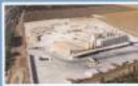
Horno, refinería de escayolas y yesos