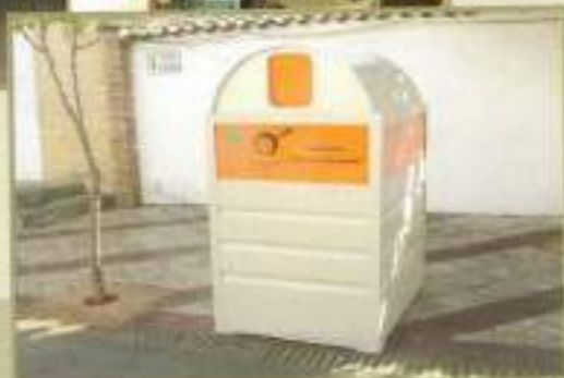
Contenedor reciclaje aceite usado