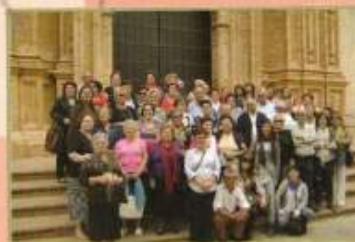
Excursión a Umbrete