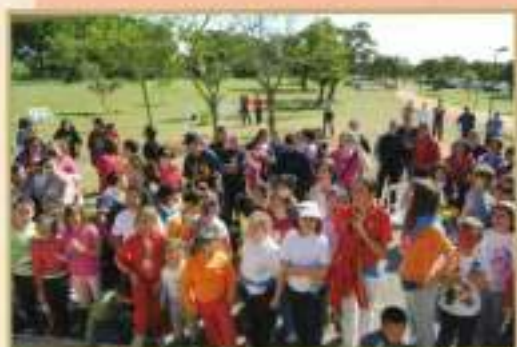
II Encuentro Interasociativo El Cuervo-Lebrija-Las Cabezas