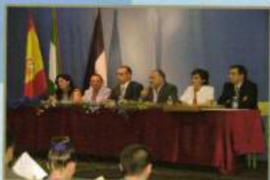
Graduación 2º Bachillerato IES