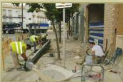
Adecantamiento de acerado urbano