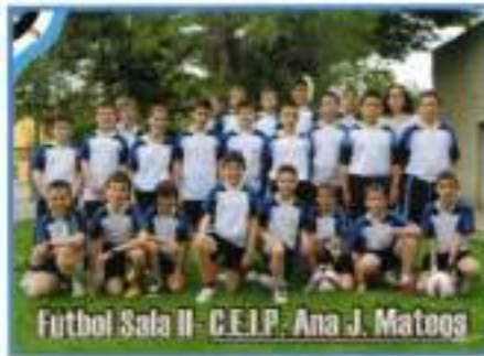
Fútbol Sala II - C.E.I.P. Ana J. Mateos