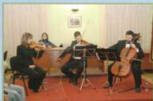
Actuación 'Trio Jonoa' Reyes 2010