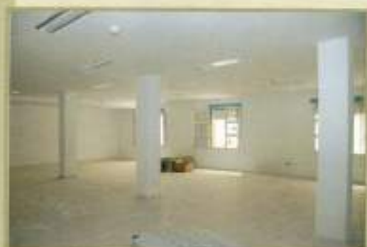
Obras sótano Casa de la Juventud