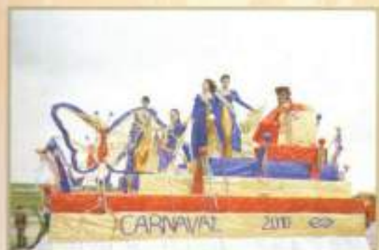
Musa y Ninfas durante el desfile de Carnaval 2010