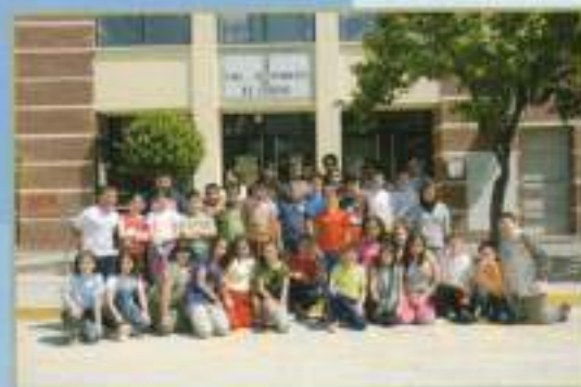
Jornadas de Puertas Abiertas