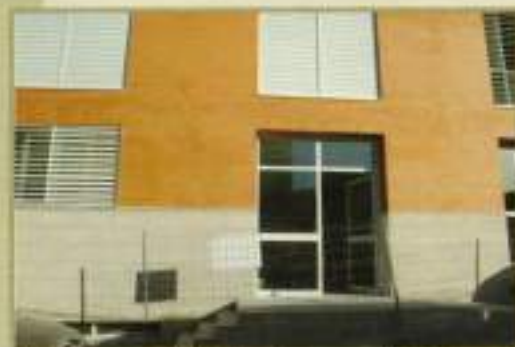
Obras y ampliación Centro de Día