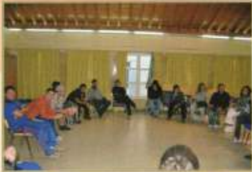
Reuniones Consejo Local de la Juventud