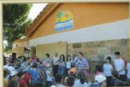
Inauguración Aula de la Naturaleza

La Delegación de Medio Ambiente, en su afán educativo de concienciación ha proyectado actividades y campañas destinadas a dar a conocer los problemas mediambientales recurrentes en nuestro municipio y a potenciar el reciclaje. Se han desarrollado actividades en el Aula de la Naturaleza, con el alumnado de los colegios, poniendo en práctica los objetivos mediambientales en el marco incomparable del entorno de la Laguna de los Tollos y el Parque Rocio de la Cámara.