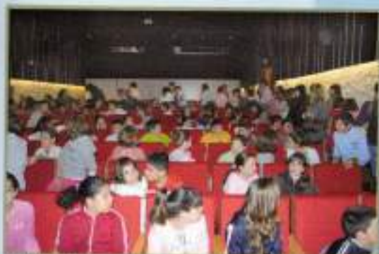
Visita Teatro alumnos Día del Libro