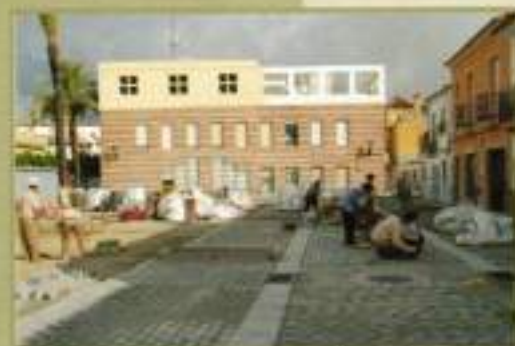
Obras en la Plaza Constitución