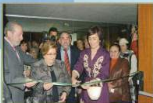
Inauguración Teatro 'El Molino' 2010