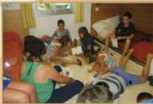
Actividades Colonias 2010