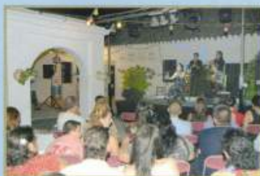
I Noche Flamenca, agosto 2010