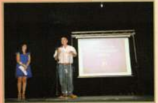
Clausura Talleres Igualdad 2010