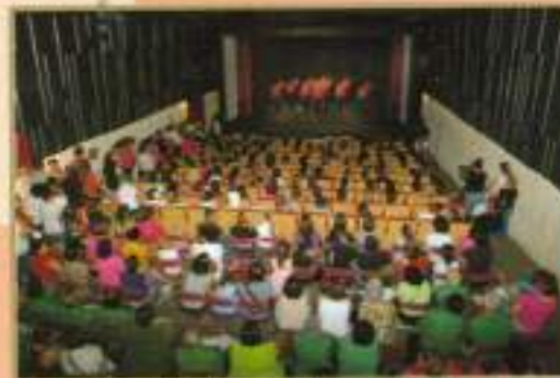
Clausura Talleres Área de Igualdad 2010