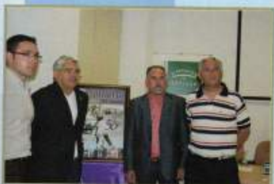
Presentación 50ª Romería Casa Provincia