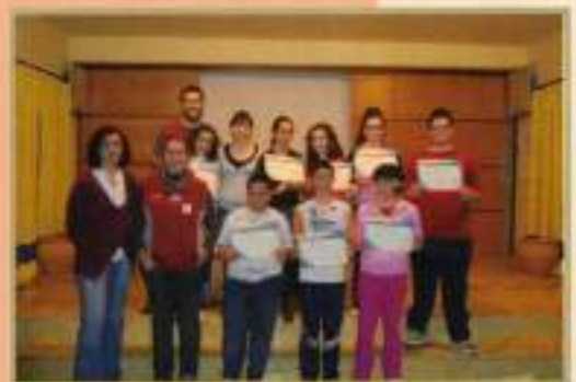
Creamos con Arte 2010