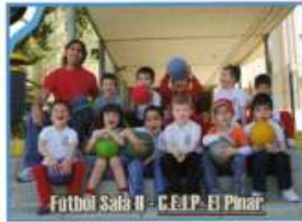
Fútbol Sala II - C.E.I.P. El Pinar