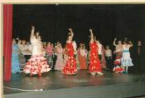
Exhibición Taller de Sevillanas