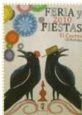
ESCEBAN ZAPATA DELGADO