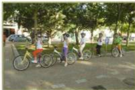
Los niños aprendiendo normas básicas de Educación Vial