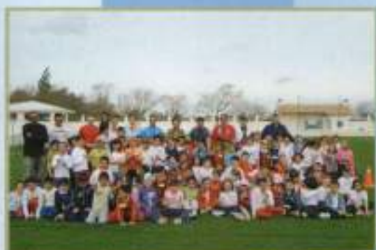
Jugamos Todos y Todas 2010