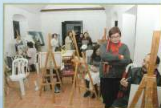
Aula de pintura municipal