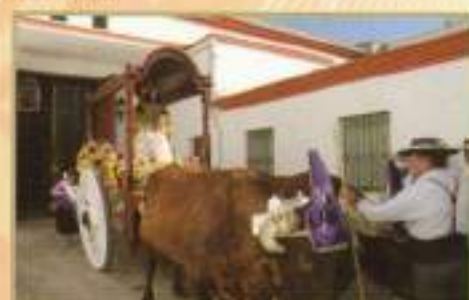
Carreta con Ntra. Patrona la Virgen del Rosario