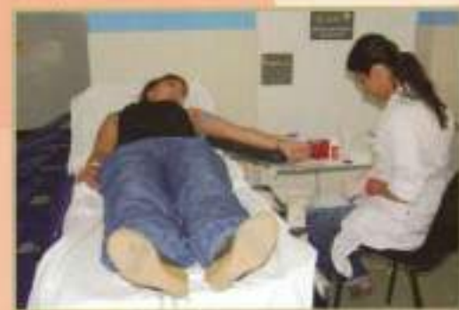
Fomento Campaña Donación