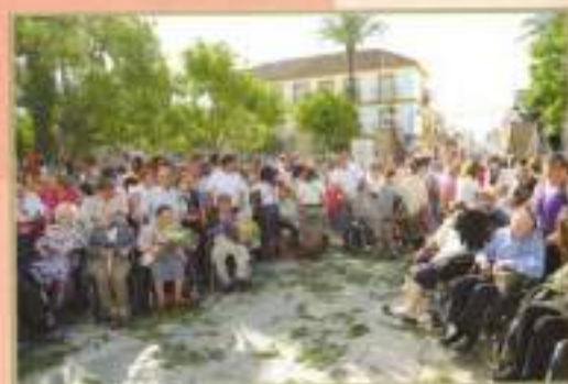
Ofrenda floral 50 Aniversario Romería