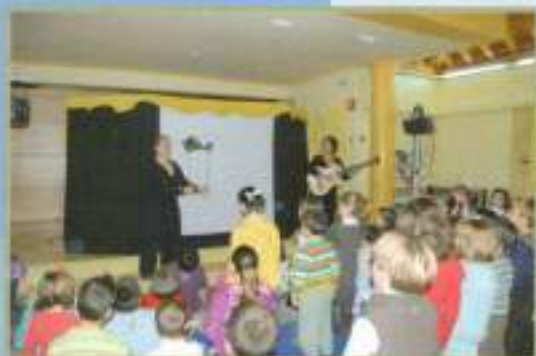
Actuación teatral 'Sol de noche'