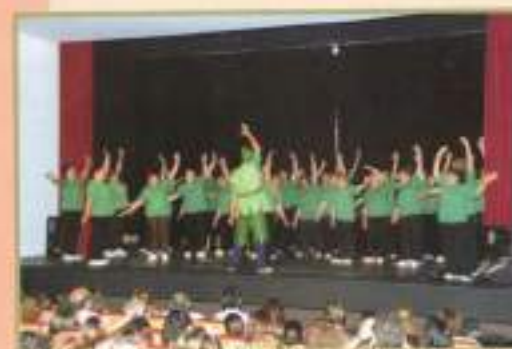
Exhibición Gimnasia Terapéutica

Por la Calidad de Vida y Participación en la Sociedad de nuestros mayores y personas con discapacidad.