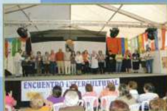
Clausura Día Pan: Asoc. Cruz de Mayo