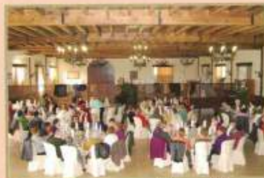
Encuentro Comarcal Asoc. Viudas

Por la Calidad de Vida y Participación en la Sociedad de nuestros mayores y personas con discapacidad.