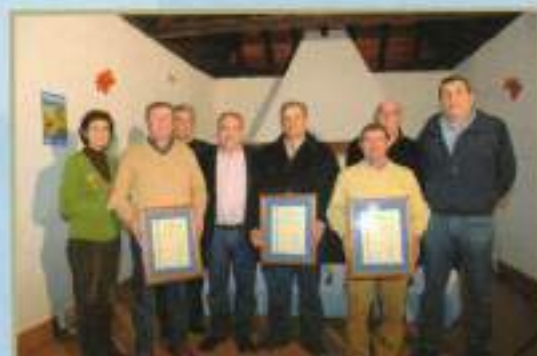
Ganadores VI Concurso de Mosto