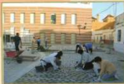
Igualdad oportunidades PER