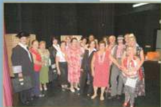
Teatro del Centro de Personas Adultas