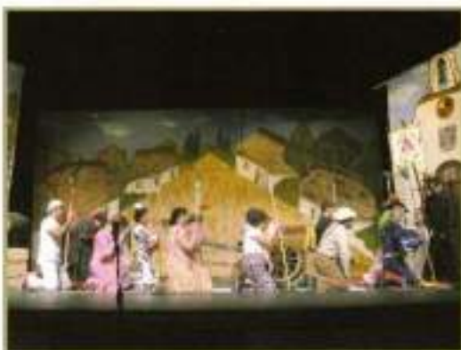
Misa Romera de la obra "Una señal inocente"