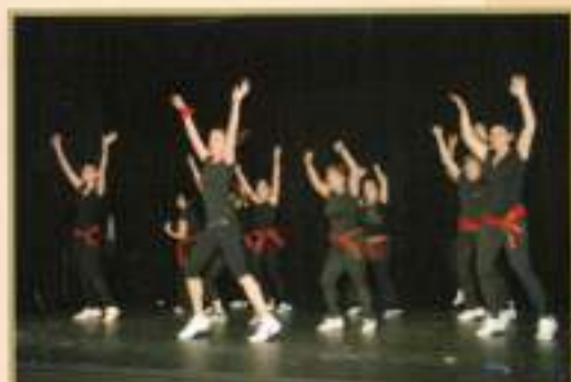
Exhibición Batuka 2010