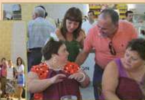
Comida Feria 2009