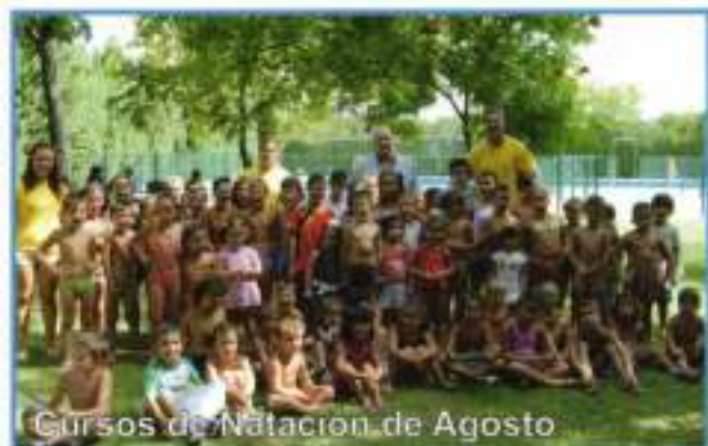
Cursos de Natación de Agosto