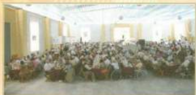
Almuerzo-Homenaje a la tercera edad durante la feria 2009