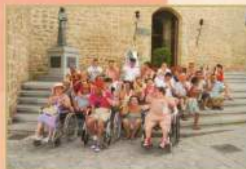
Visita Castillo de Luna 2010