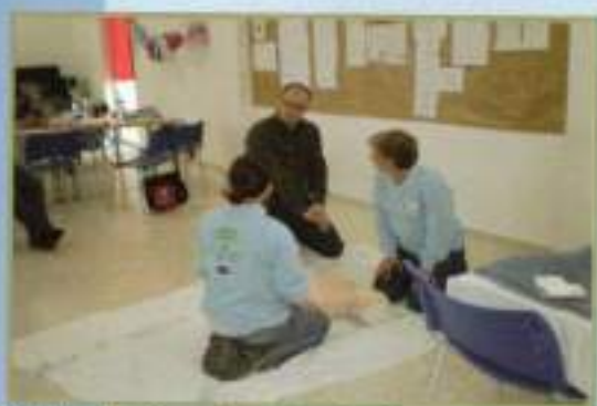
Taller de Empleo: Geriatria