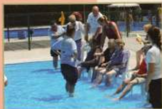
Jornadas piscina Mayores