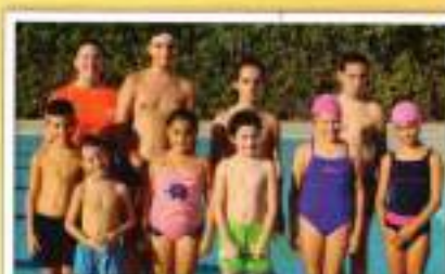
Agosto aprendizaje tarde