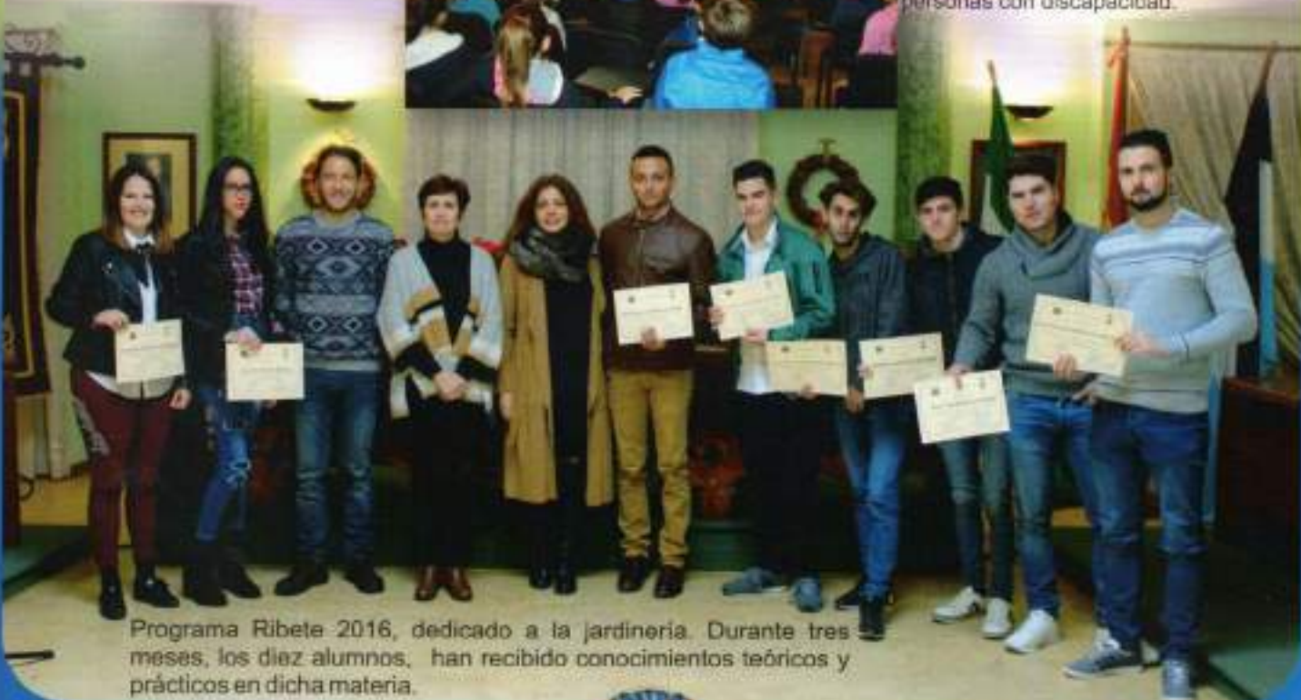
Programa Ribete 2016, dedicado a la jardinería. Durante tres meses, los diez alumnos, han recibido conocimientos teóricos y prácticos en dicha materia.