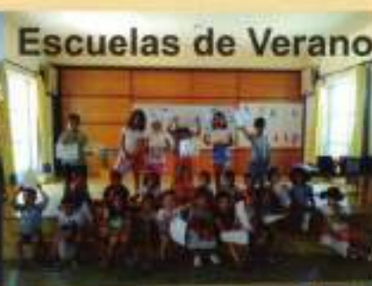
Escuelas de Verano