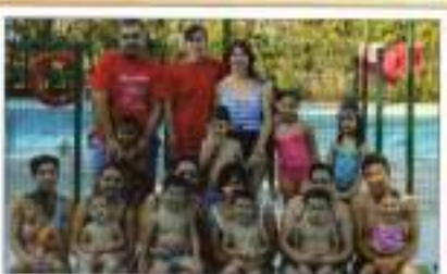
Julio niños con adultos (tarde)