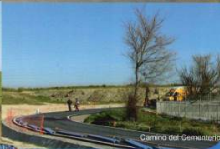
Camino del Cementerio