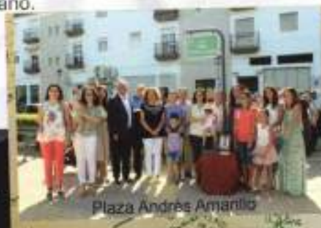
Plaza Andrés Amariño