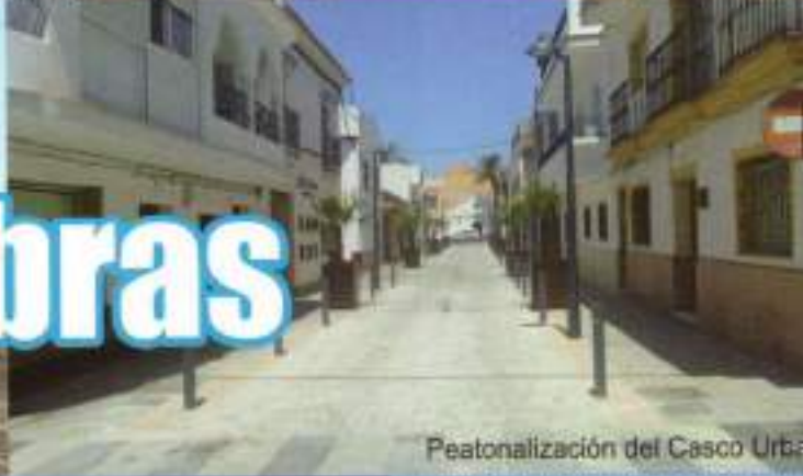
Peatonalización del Casco Urbano