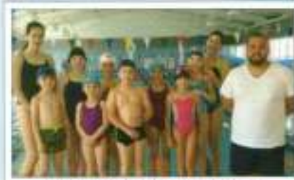
Natación de Invierno