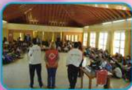
Taller de Risoterapia