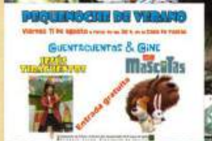
PEQUEÑOS DE VERANO

VIERNES 11 DE AGOSTO a partir de las 18h en el CDS de PARRAL