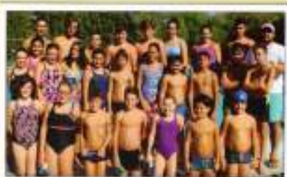
Escuela Deportiva de Natación (mañana)