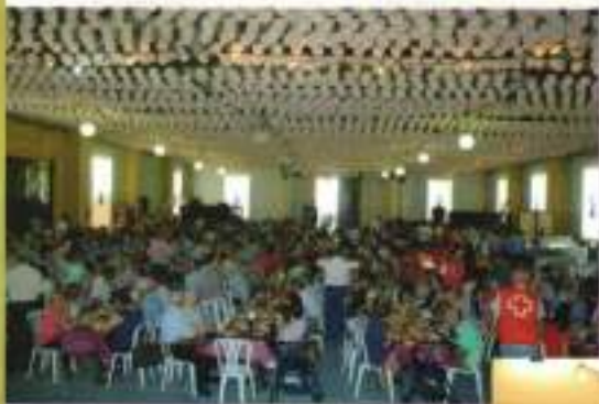
Comida de mayores en la Feria 2016.