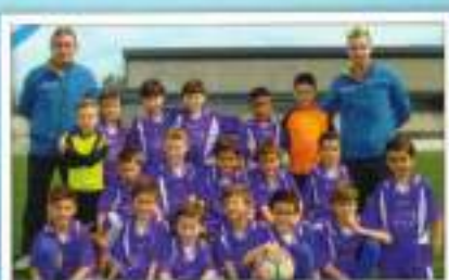
Fútbol 7 Probenjamín