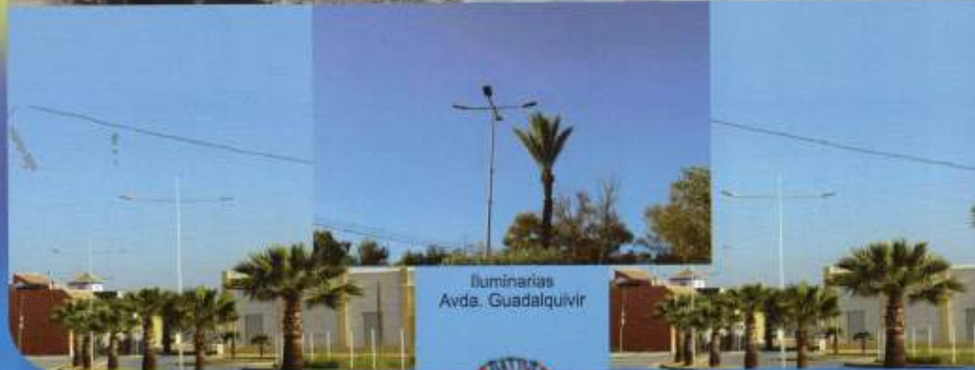
Iluminarias Avda. Guadalquivir