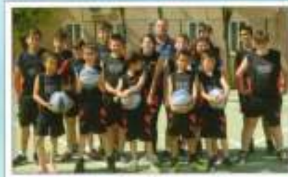
Baloncesto CEJP El Pinar