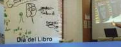
Día del Libro