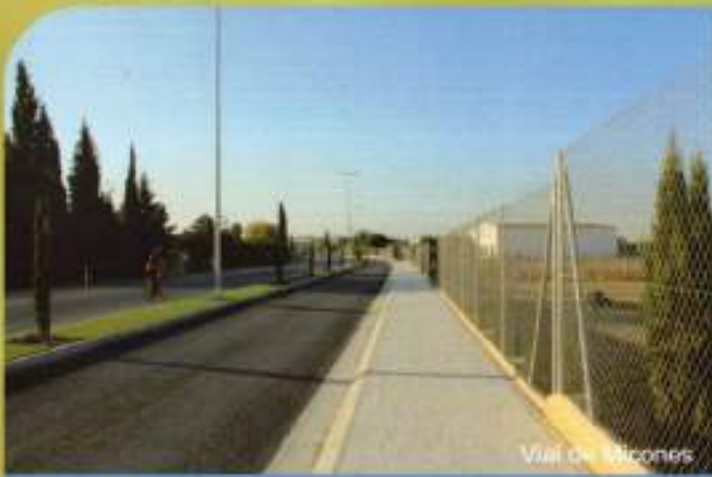
Vial de Micones