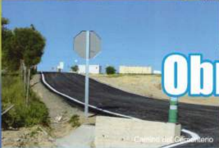
Camino del Cementerio