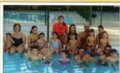
Agosto niños con adultos (tarde)