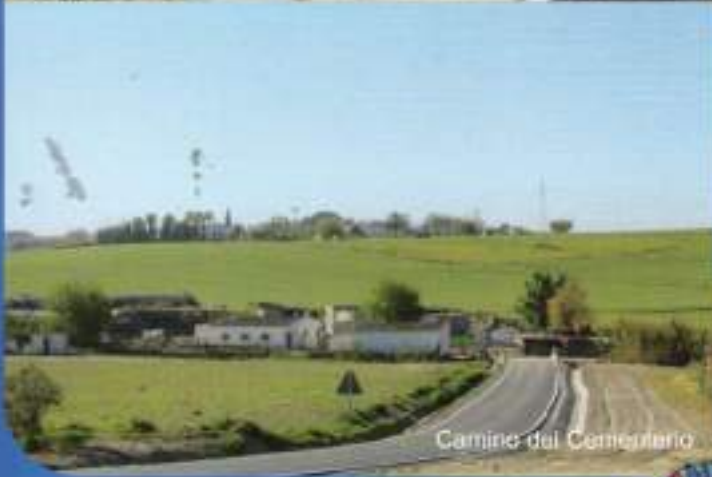
Camino del Cementerio