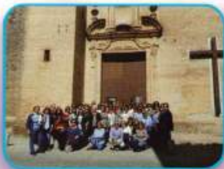
Viaje a Carmona