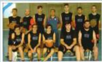
Baloncesto JES El Tollón