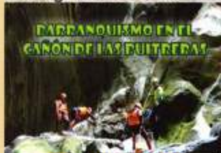
PARRANQUEISMO EN EL CANON DE LAS PUITREDAS