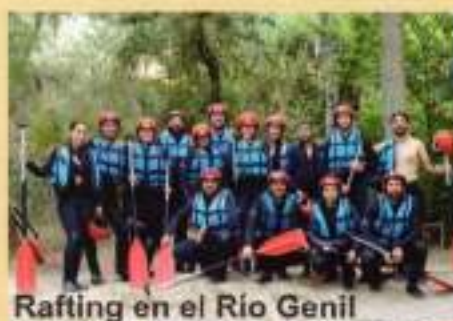
Rafting en el Río Genil