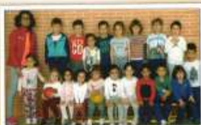
Predeporte CEJP A. Gala