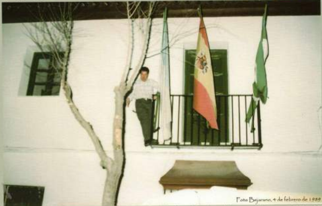
4 de febrero de 1989