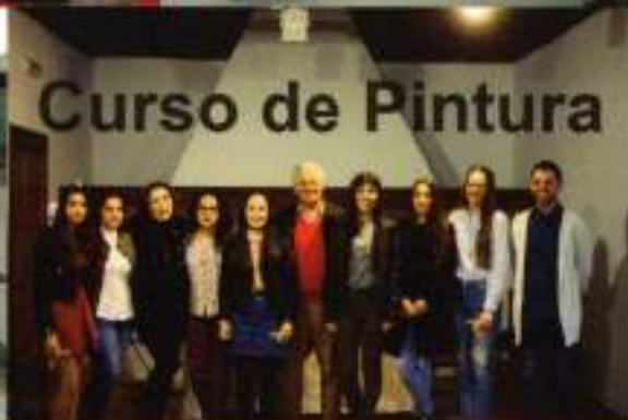
Curso de Pintura