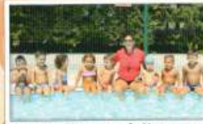
Agosto niños con adultos (mañana)