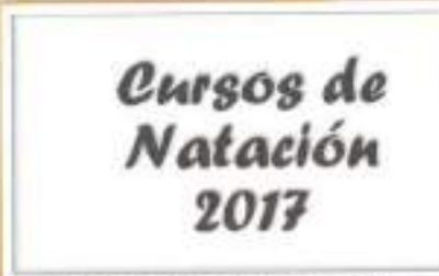
Meses de julio y agosto