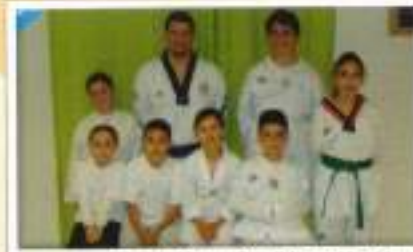
Taekwondo Nivel JJ