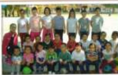
Predeporte CEJP A. J. Mateos