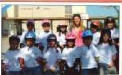
Patinaje CEJP A. J. Mateos