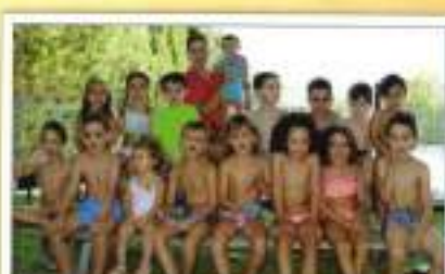
Julio niños con adultos (mañana)