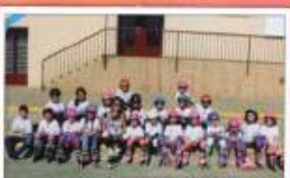
Patinaje CEJP El Pinar