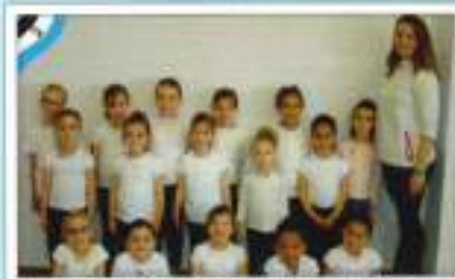
G. Rítmica Iniciación