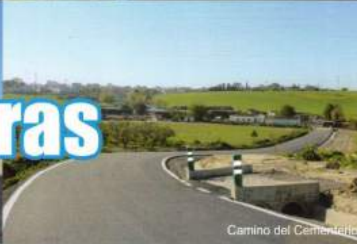
Camino del Cementerio