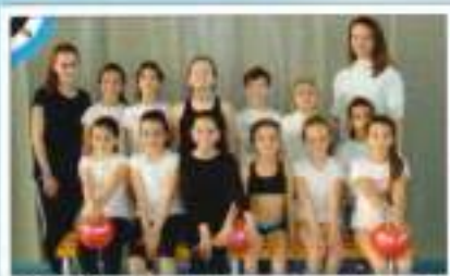
G. Rítmica Benjamín-Alevín