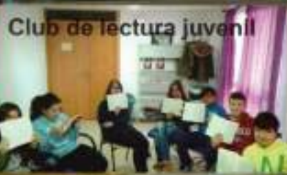
Club de lectura juvenil