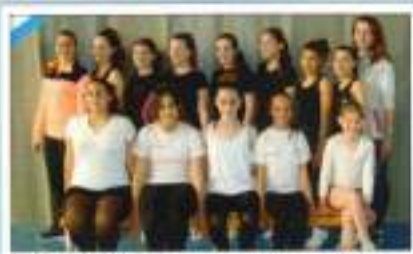
G. Rítmica Infantil-Junior