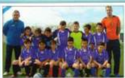
Fútbol 7 Benjamín