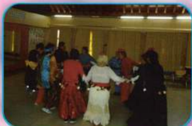
Carnaval, Talleres de Igualdad