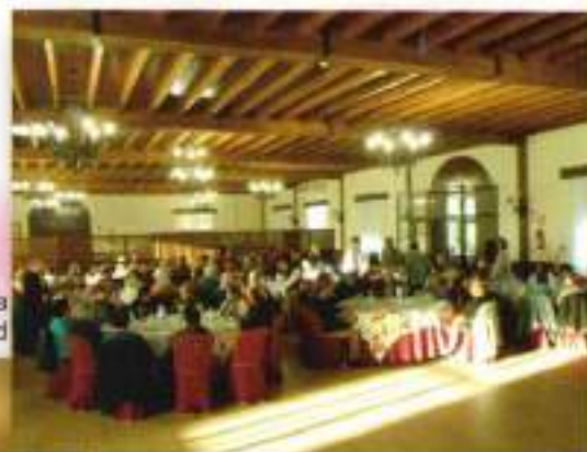
Merienda-Convivencia de Navidad