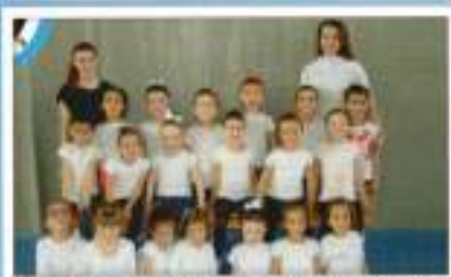
G. Rítmica Probenjamín-Benjamín