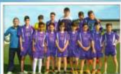
Fútbol 7 Infantil