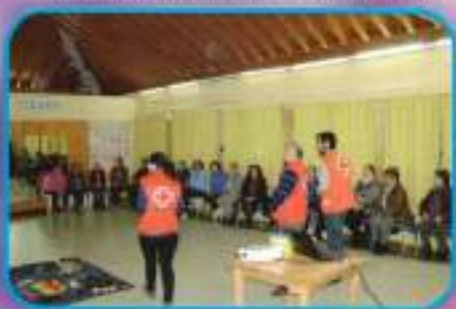
Taller de Musicoterapia