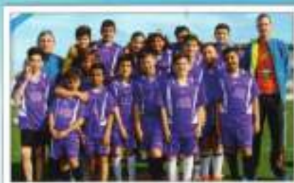
Fútbol 7 Alevín