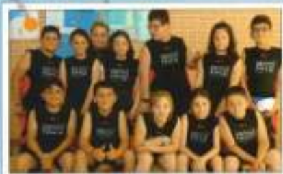
Baloncesto CEJP Antonio Gala