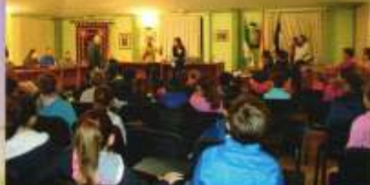
Día internacional de las personas con discapacidad.