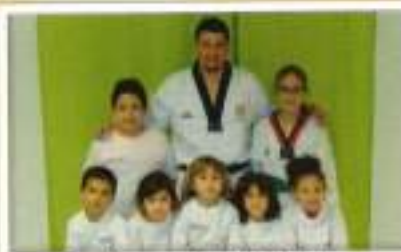
Taekwondo Nivel J