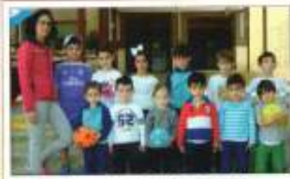
Predeporte CEJP El Pinar