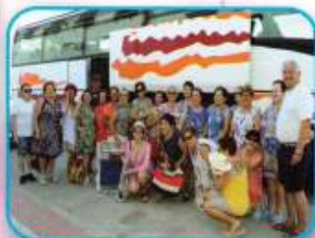
Convivencia, Playa de Rota