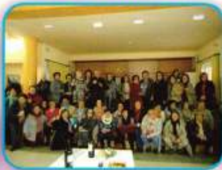
Merienda Navideña Talleres de Igualdad