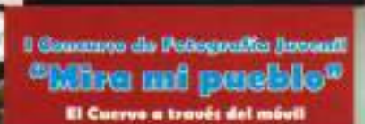
I Concurso de Fotografía Juvenil "Mira mi pueblo" El Curro a través del móvil