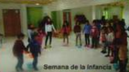
Semana de la infancia