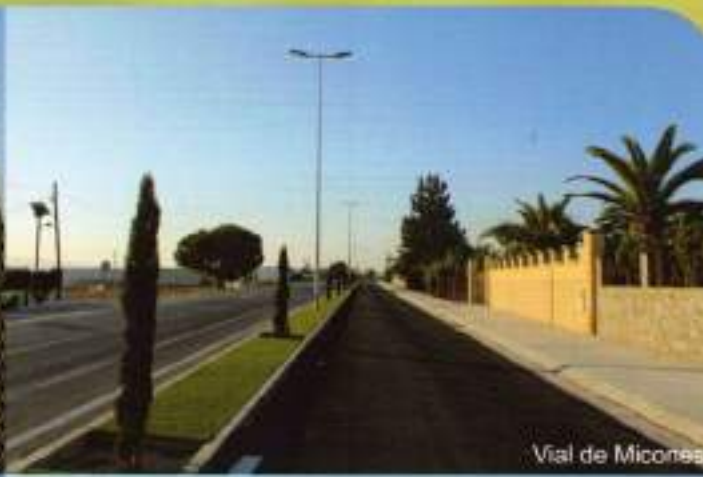
Vial de Micones